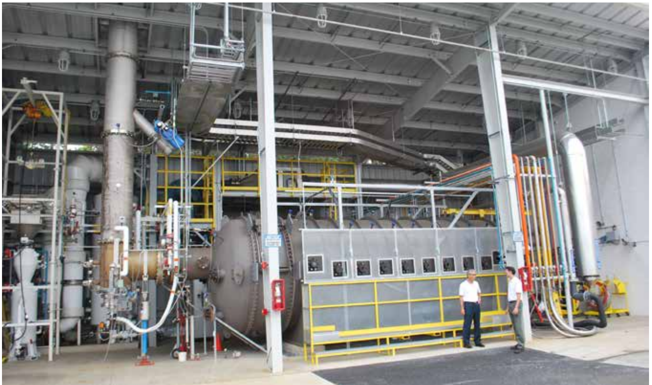
Das moderne Clean Energy-Labor von Air Products ermöglicht die Entwicklung und umfassende Tests neuer sauerstoffgestützter Verbrennungstechnologien.